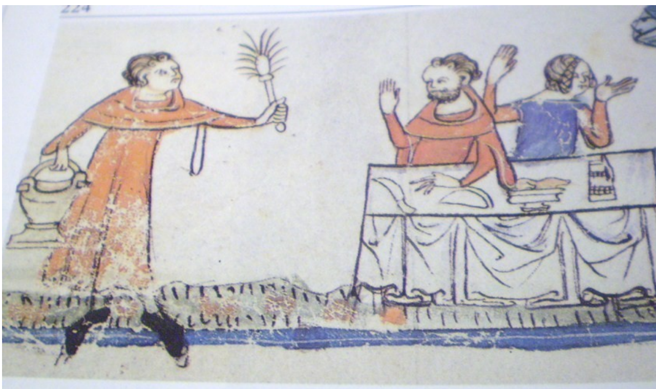
Präst som välsignar mat med vigvattenkvast. 1300-talets mitt.

En undersökning av nordiska testamenten och kyrkans regler rörande prästernas klädsel